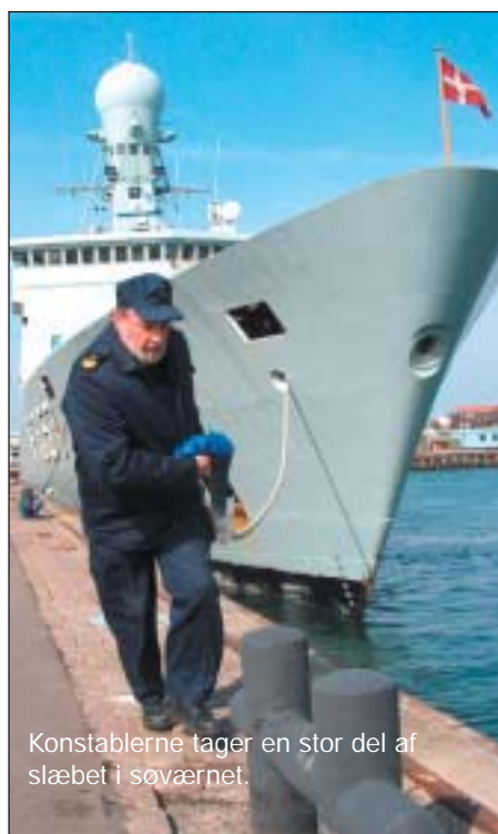
Konstablerne tager en stor del af slæbet i søværnet.

hold til de øvrige elever, at få en uddannelse med fuld løn, uden at skulle spekulere på økonomien."