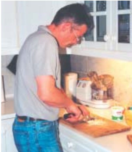
Han er faktisk helt ferm som 'køkkenskriver', hvor han laver spændende og god mad, helst italiensk, hvortil der kan drikkes en god italiensk vin.