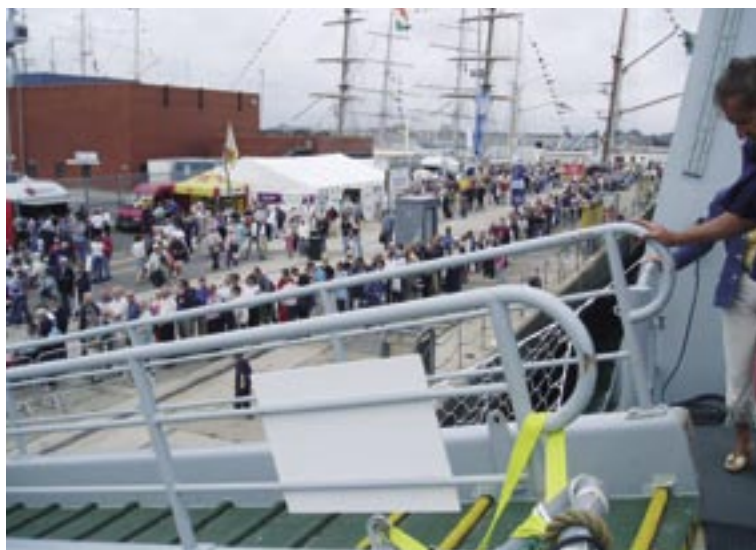
Der var kø på kajen i Portsmouth for at komme ombord på ABSALON.

Der er ingen tvivl om , at Englænderne er glade for admiral Horatio Nelson og VICTORY; Nelsons gamle skib som ligger i dok i Portsmouth. VICTORY er gennemrestaureret og dagligt åbent for besøgende. Det er tiden værd at tage en tur ind og se