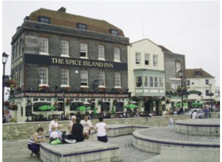
Hyggestund på en plads i Portsmouth.

Lige neden for er der selvfølgelig en lystbådehavn i bedste Monaco-stil. Der er ikke så forfærdelig mange pladser, men de pladser der er, er fyldt op. Og hvilke fartøjer! På et tidspunkt sad vi på en terrasse med en lille forfriskning, og så efter en flyver eller helikopter, som vi forventede ville flyve over os. Men vi opdagede, at det var en stor racerbåd, der havde startet motoren. Øjne og øre var ved at falde ud, da han/hun startede motor nummer to. Den fri udstødning fra de to dybt rumlende motorer fik det til at løbe koldt ned af ryggen, da de fik lidt saft at leve af. Det var helt sikkert benzinmotorer. Heller ikke noget for en konstabel løn. Der var også et bådudlejningsfirma på havnen, og vi talte da et øjeblik om, at det kunne være