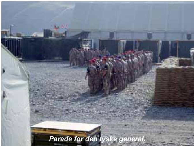
Parade for den tyske general.

Jeg har været forkølet de sidste 3½ dag på grund af vores aircondition i FAB'en. Den skal man altså bare bruge rigtigt. Tyskerne indlægger normalt ikke en på lazarettet, men giver nogle tabletter, og man kan gå tilbage i sin FAB og smitte de 2 andre, eller hvem man nu kommer i berøring med, da det er en virus, men pyt med det, mener tyskerne. At man så lige er blevet meget upopulær, ja det hører nok med. Men det er skønt ikke at