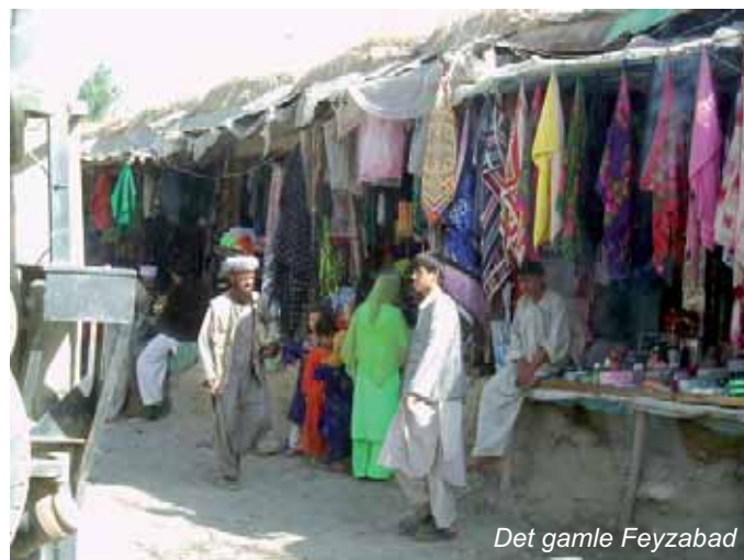
Det gamle Feyzabad

Efter at havde checket ind, gik vi over og fik noget morgenmad. Vi skulle være tilbage 0645, og være klar til at gå ombord 0700. At den så blev 1000, ja sådan går det hervede. Det slår Grønland. Der blev lavet om på prioritets rækkefølgen og man bestemte at en flyver skulle flyve til Feyzabad med cargo, og derefter flyve til Kunduz, hvor vi så ville komme med en tysk Transall, og blive fløjet vider derfra med