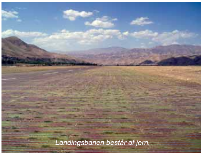
Landingsbanen består af jern.

Så er DK kommet på som deltager i rundtursflyvningen. En Hercules landede her til morgen (28. juli) i Kabul, og er planlagt til at komme herop torsdag i næste uge. Så vi må hellere få lavet en lille velkomst komite, så de har noget at komme helt herud for,