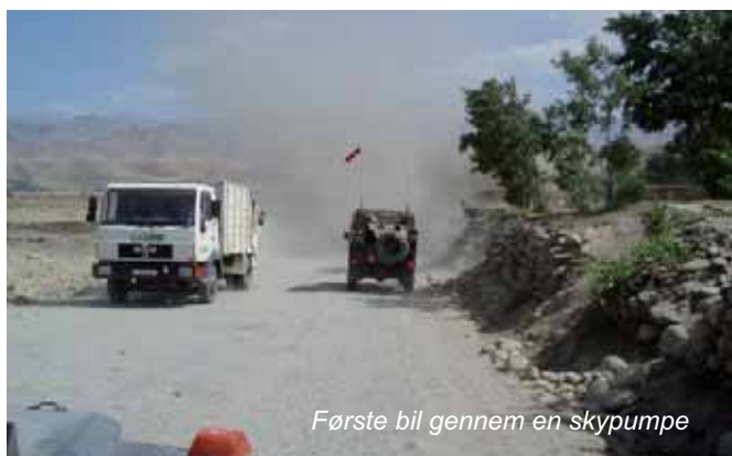
Første bil gennem en skypumpe

I EB artikel nævner de også lønnen og ja, jeg vil da gerne have min fordoblet, så jeg tjener 40.000. Det vil da ikke være af vejen, men så heldig er jeg nok ikke, og det hjælper nok heller ikke at sige det på lønningskontoret, at jeg ikke har fået, det der står i Ekstra Bladet. Men jeg synes artiklen er rimelig, den fortæller om de frustrationer vi har, ved at man ikke har tænkt sig om hjemme i Danmark. Og når man så ser tysker & tjekkerne køre ud og passer deres, så er det træls at være dansker hernede. Ret skal være ret, og det skal lige nævnes, at også de andre nationer fra tid til anden har problemer med deres biler og mangel på reservedele.