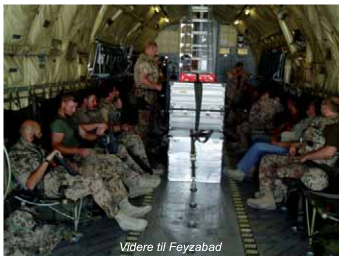
Videre til Feyzabad

Vi var sat til at skulle med en flyver om fredagen, og vi skulle checke ind omkring 0700 om morgen. Vi var så heldige,