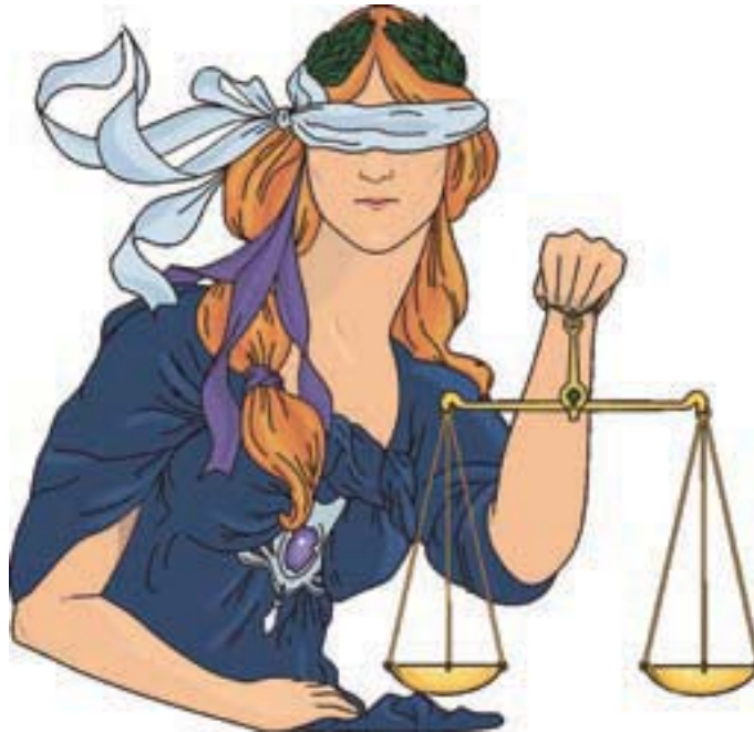
Mon fru Justicia kan hjælpe med mere retfærdighed for konstablerne i forsvaret. Ja - muligheden er der.

De militære chefer kan, hvis de er i tvivl, forelægge spørgsmålet for en auditor, som har den endelige afgørelse af, om det er en straffesag eller disciplinarsag.